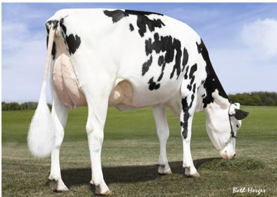
MS C-HAVEN OMAN KOOL THIRD DAM