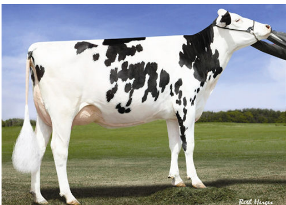
MS C-HAVEN OMAN KOOL THIRD DAM