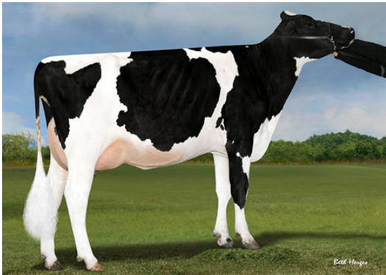
PROGENESIS SUPERSHOT KASSIDY DAM